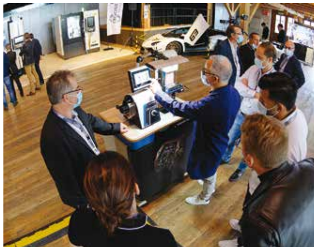
Présentation du poste de polissage compact spécialement décoré pour les boutiques Richard Mille.

Parmi les machines manuelles, semi-automatique et CNC du catalogue Crevoisier, les participants ont eu l'occasion de découvrir 6 nouveautés dédiées à la réalisation de terminaisons et de décorations.